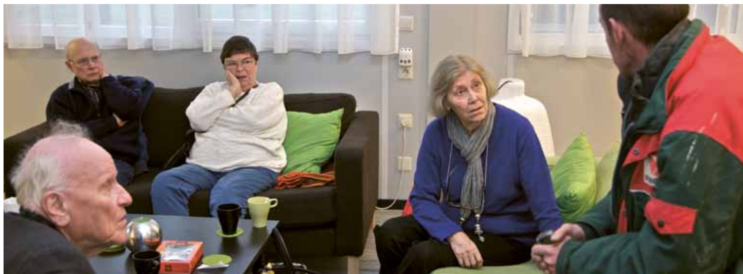
Bewoners stellen in de huiskamer vragen aan de uitvoerder

De renovatie aan de binnenkant van de 345 woningen aan de Kwango-, Zebra- en Gambiadreef is zo goed als klaar. Woningcorporatie Bo-Ex is in september begonnen met het vernieuwen van de keuken, badkamer en toilet.